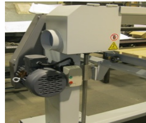
Moteur de la courroie