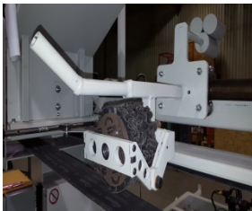
Roue de contact