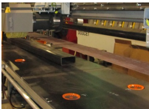
Table avec ventouses