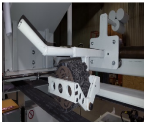
Roue de pression