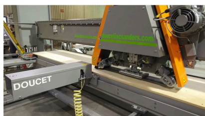
CAPACITÉ DE PONÇAGE EST DE 30" DE LARGEUR X JUSQU'À 24' DE LONGUEUR