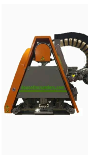
CHARIOT DE POLISSAGE