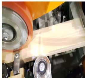
Applicateur à colle