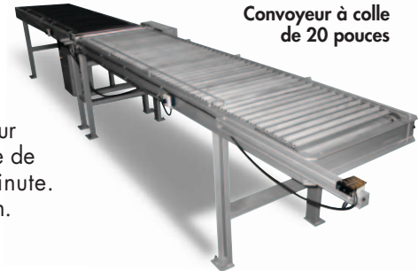
Convoyeur à colle de 20 pouces

Le convoyeur à colle Doucet comprend un rouleau à colle en acier inoxydable précédé et suivi de convoyeurs d'entrée et de sortie à barres transversales, le premier en acier doux et le second en acier inoxydable.