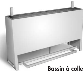
Bassin à colle

Le bassin à colle Doucet est un dispositif simple et efficace permettant d'appliquer la colle pour la confection, entre autres, de dessus de table et de marches d'escalier lamellées. Après avoir trempé le grillage en acier inoxydable dans le réservoir, on y dépose tout simplement le matériel; l'adhésif s'y transfère au contact du grillage. La dimension du grillage est de 6 pouces de largeur par 48 pouces de longueur.